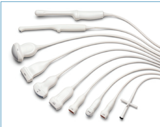
Umfangreiche Palette an Schallköpfen für die Sonographie

Ergonomisches Design mit leichten, sehr flexiblen Kabeln