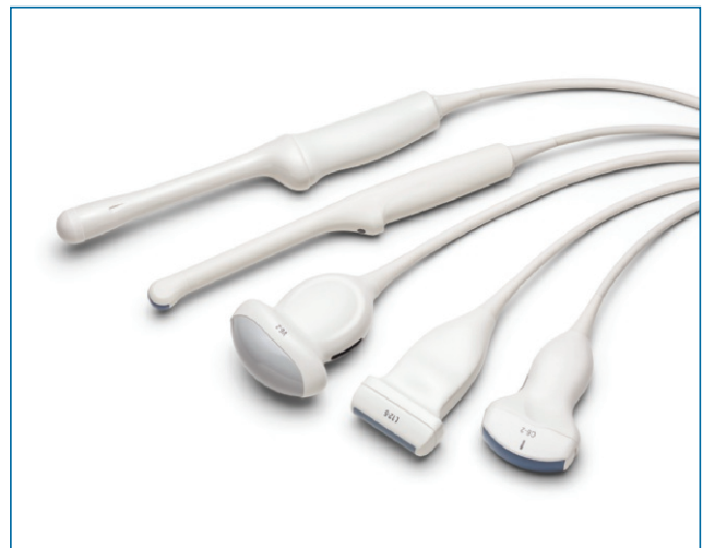
Für Anwendungen in der Frauenheilkunde entwickelt